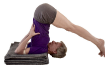
7. Halasana, Zehen auf Boden oder Stuhl