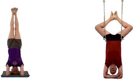
1. Sirsasana , frei, gegen die Wand, oder im Wandseil