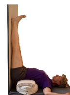
10. Viparita Karani, gegen Wand, über ein oder zwei Polster