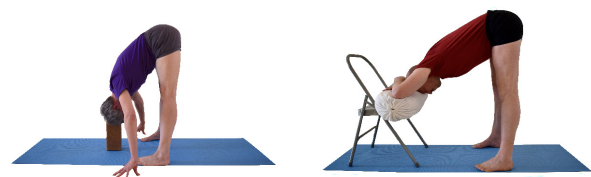
1. Uttanasana, Kopf auf Klotz oder Stuhl