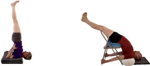
2. Salamba Sarvangasana , frei oder auf dem Stuhl