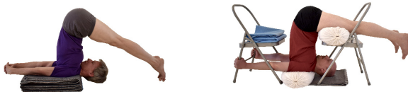
3. Halasana , Zehen auf Boden oder Oberschenkel auf Stuhl